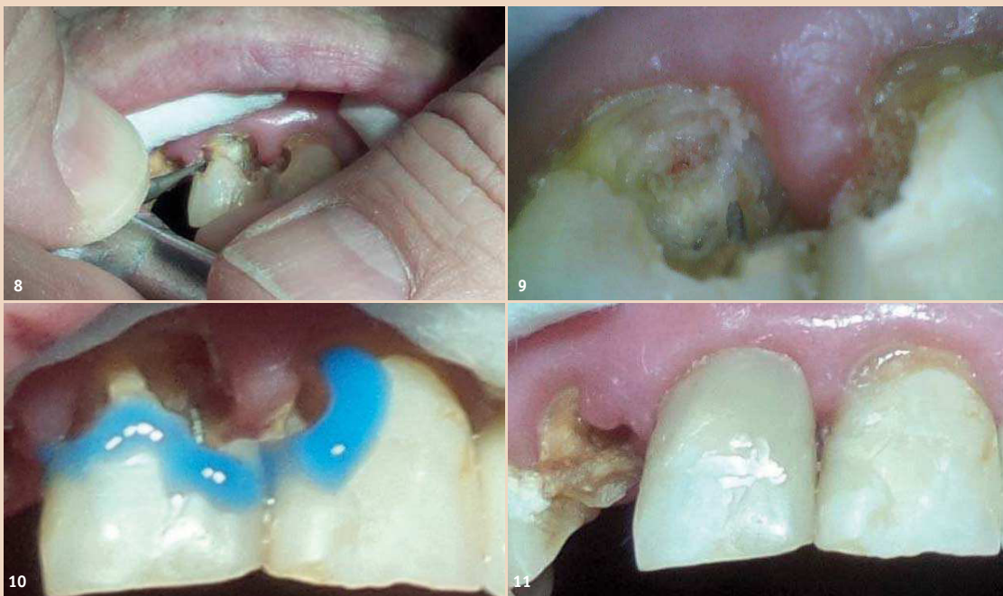
Abb. 8: Reizarmes, bimanuelles Exkavieren. – Abb. 9: Eröffnete Pulpa. Die Karies muss noch entfernt werden. – Abb. 10: Fertig exkaviert, Ätzen ohne Anschrägung, dann direkte Überkappung mit Syntac Classic und Flow. – Abb. 11: Komposit ohne Politur.

mit Rotationsbewegungen, sodass der Kopf nicht hin und her schaukelt. Die Luxationsbewegungen werden mit Pausen unterbrochen. In den Pausen finden intraalveolär zusätzliche desmodontale Ablösungsvorgänge statt. Nach der Entfernung des Zahnes wird die Alveole mit einem Finger und evtl. mit einer unterlegten Watterolle zugepresst, sodass möglichst wenig Blut entweicht. Nach der Koagulation wird mit trockenen und feuchten Watterollen das Blut im Mund und an den Lippen weggeputzt. Die Patienten schlafen meistens schon während der Behandlung ein. Die Heilung erfolgte bisher immer komplikationslos und ohne beobachtbare Schmerzsignale oder Verhaltensänderungen.