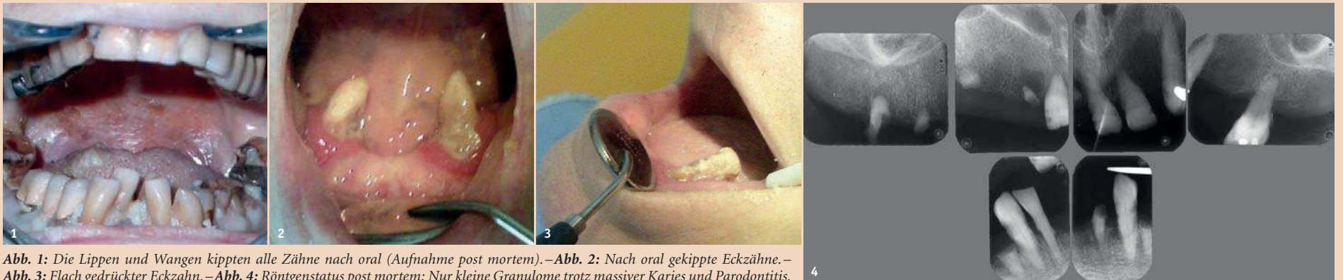
Abb. 1: Die Lippen und Wangen kippten alle Zähne nach oral (Aufnahme post mortem). – Abb. 2: Nach oral gekippte Eckzähne. – Abb. 3: Flach gedrückter Eckzahn. – Abb. 4: Röntgenstatus post mortem: Nur kleine Granulome trotz massiver Karies und Parodontitis.

Von der Empfehlung einer Räumung zur Empfehlung, die Frontzähne mit Komposit zu erhalten. Von Dr. med. dent. Walter Weilenmann, Wetzikon.